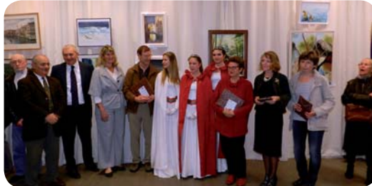
Les lauréats du Salon d'Automne 2011