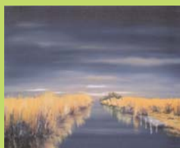
Reflets sur le Charnier