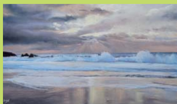
Lumière de Belle-Ile